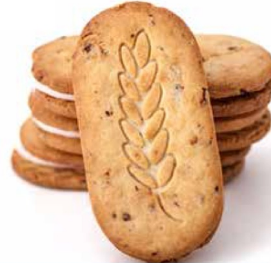
Cream Filled Sandwich with Berries