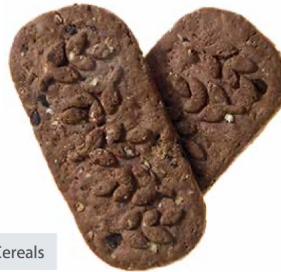
Chocolate and Cereals