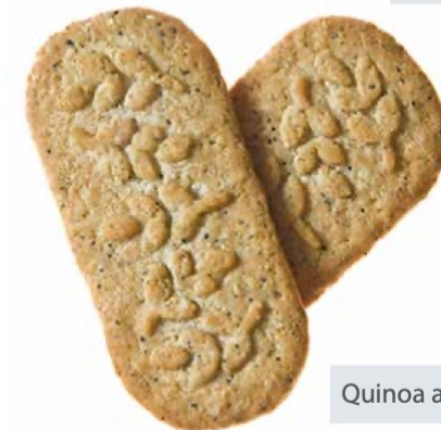
Quinoa and Cereals