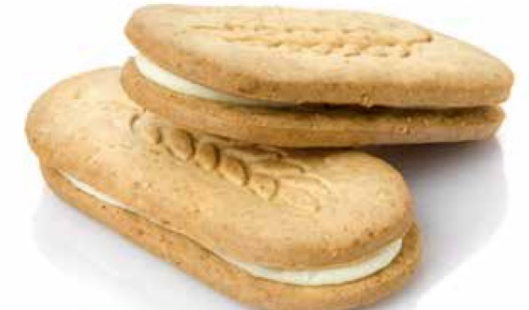
Honey and Yogurt Filled