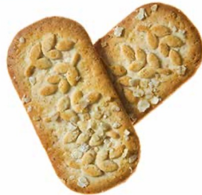
Milk and Cereals