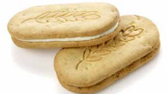
Coconut and Yogurt Filled